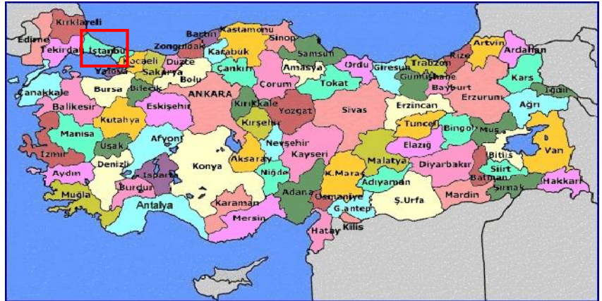
Harita 1 - İstanbul'un Konumu

İstanbul, Türkiye'nin en büyük kenti olup, yıllık %0 33.1 nüfus artışı ve 10 milyon kişiyi aşan nüfusu ile dünyanın da sayılı kentlerinden biri haline gelmiştir. Batı ile Doğu arasında köprü olma özelliği ile yerli ve yabancı sermaye için, bölgelerarası ilişki kurma ve bölgelere açılma yönünden önemli bir merkezdir. İstanbul Boğazı, Karadeniz'i, Marmara Denizi'yle birleştirirken; Asya Kıtası'yla Avrupa Kıtası'nı birbirinden ayırmakta ve İstanbul kentini de ikiye bölmektedir.